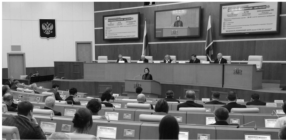
Заседание Совета представительных органов муниципальных образований

По запросу муниципальных депутатов в повестку был включен вопрос о реализации проекта «Комплексная система обращения с твердыми коммунальными отходами».